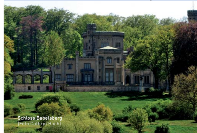
Schloss Babelsberg

... an dem Sie auf kaiserlichen Spuren wandeln können? Schloss Babelsberg in Potsdam wurde 1833 nach den Plänen von Karl Friedrich Schinkel direkt an der Havel erbaut. Es diente dem späteren Kaiser Wilhelm I. als Sommerresidenz und ist dem englischen Tudorstil nachempfunden. Der dazugehörige Park wurde von Peter Joseph Lenné und Fürst von Pückler-Muskau als englischer Landschaftsgarten angelegt und eignet sich hervorragend für einen ausgedehnten Frühlingsspaziergang.